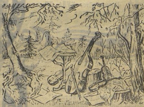
Рис. Л. СМЕХОВА.

Куда-то спрятались музыканты... Найдите их и скажите, из какой они басни?